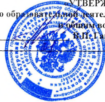
ГРАФИК ПРАКТИК НА 2022-2023 учебный год