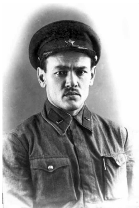
Лето 1941 г., г. Ленинград.

Будущий светила отечественной хирургии Ф. Г. Углов при знаках различия военврача 3 ранга, что соответствовало капитану.