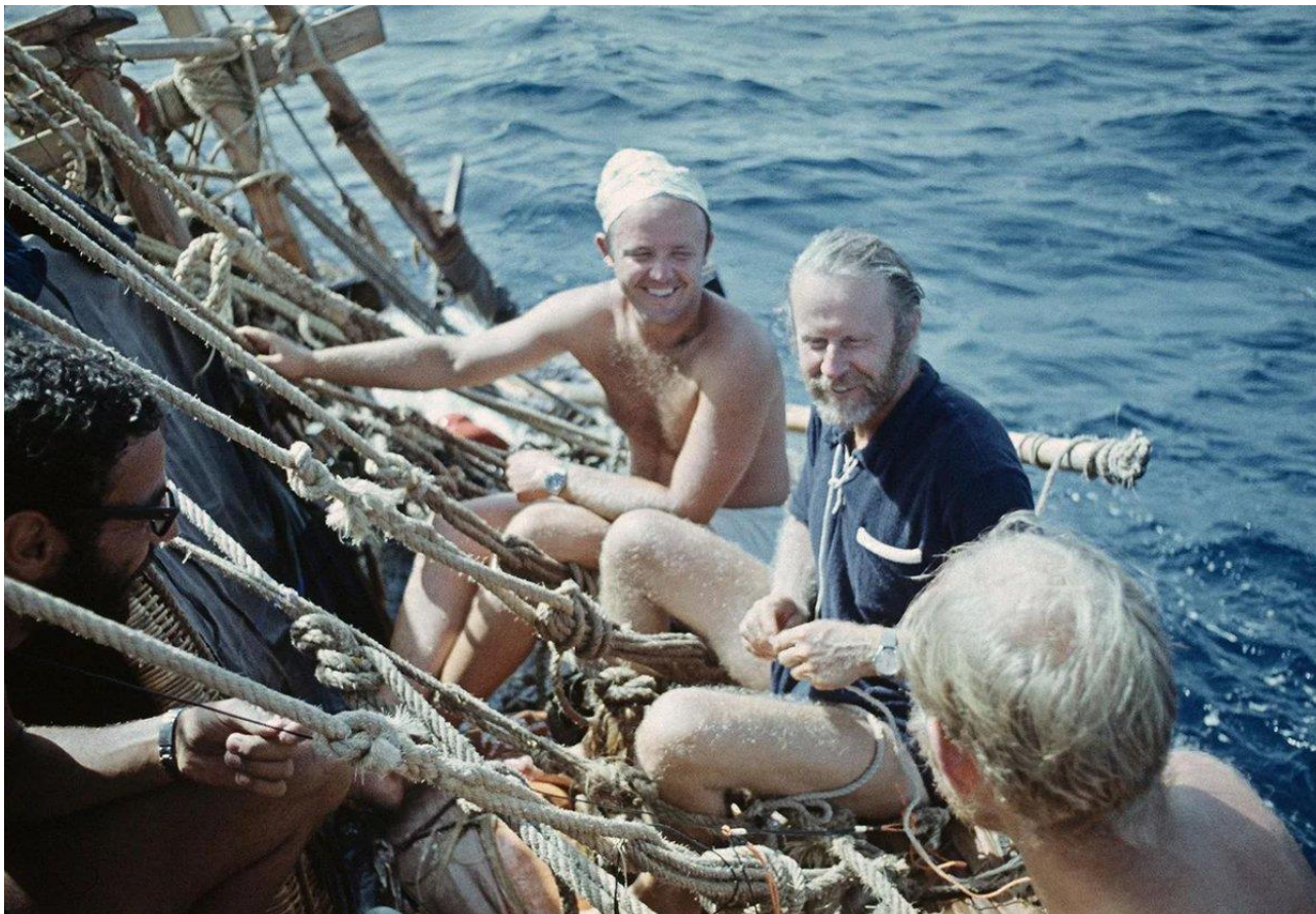
Юрий Сенкевич и Тур Хейердал во время путешествия на папирусной лодке «Ра», 1969 год.

Яцек Палкевич, Михаил Малахов, Федор Конюхов, Владимир Чуков и многие другие известные путешественники. «Клуб путешественников» получил ряд международных и национальных премий, среди которых были «ТЭФИ» и «Хрустальный глобус». Юрия Сенкевича за многолетнюю работу на телевидении в 1997 году избрали академиком Российской телевизионной академии.