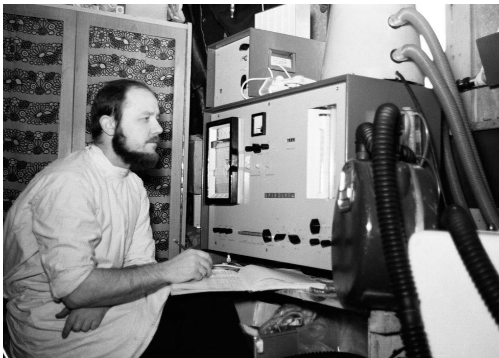
На снимке: Юрий Сенкевич. Советская антарктическая станция "Восток" 1967 год.

Ученый принимал участие в организации и медико-биологическом обеспечении управляемых полетов в космос, как с людьми, так и с животными, работал над решением фундаментальных и прикладных проблем авиакосмической биологии и медицины. Под руководством Юрия Александровича был выполнен ряд научных работ, посвященных исследованию механизмов нарушения физиологических функций живых организмов в условиях невесомости, разрабатывались методики отбора и подготовки космонавтов.