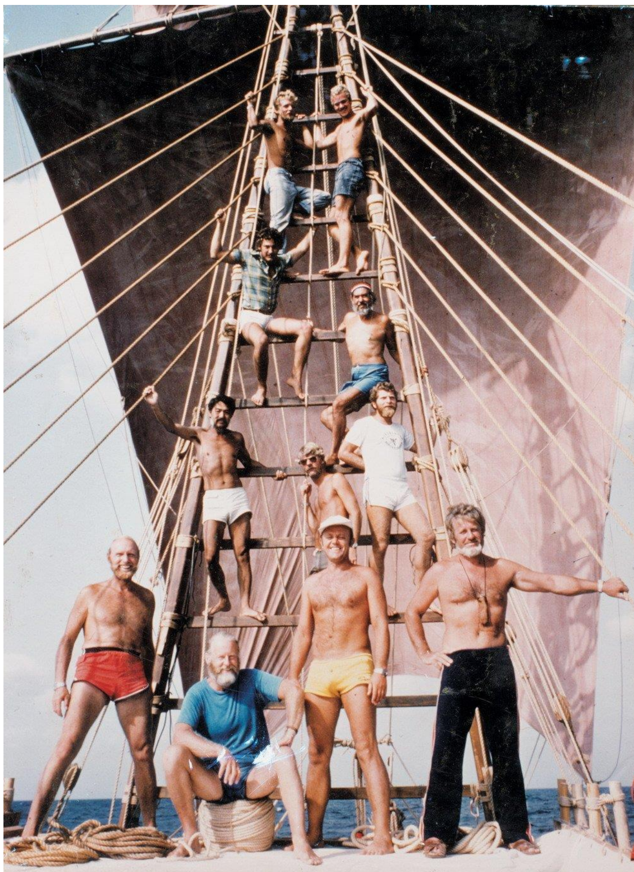
Экипаж тростниковой лодки «Тигрис» в 1978 году. Сидит Тур Хейердал, справа Юрий Сенкевич.

Научно-познавательный проект МУЗЕЙНО-ГАЛЕРЕЙНЫЕ ЛЕСТНИЦЫ "СТУПЕНИ К ПОЗНАНИЮ: ИСТОРИЯ, НАУКА, ТАЛАНТ" Врачи: отечественные выдающиеся деятели литературы, искусства, культуры