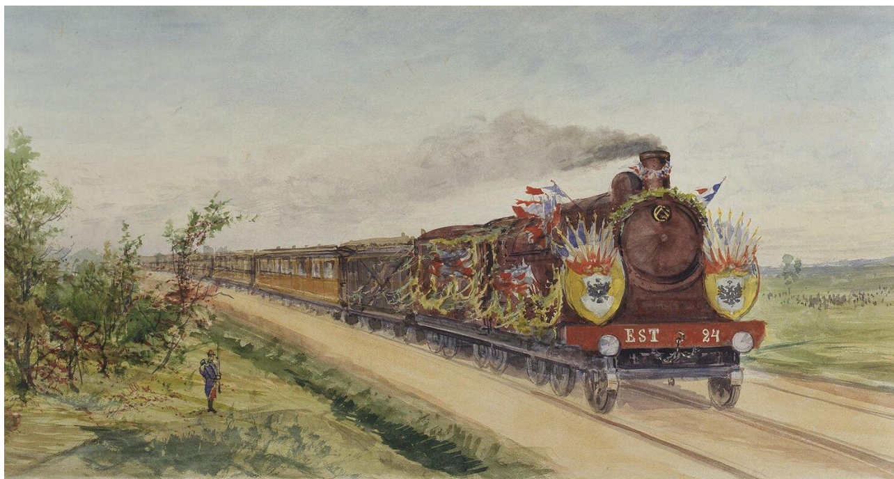
Пясецкий П. Я. Императорский поезд на пути от Дюнкерка до Шампани Фрагмент панорамы «Пребывание Их Императорских Величеств во Франции в 1901 г.»