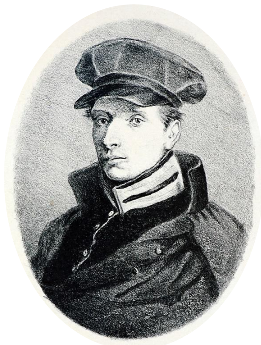
В. И. Даль в молодости