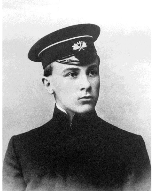
Михаил Булгаков, 1908 год

Во время Первой мировой и Гражданской войны работал фронтовым врачом. В 1920 году переболел тифом. В 1921 году Михаил Афанасьевич переехал в Москву, где подрабатывал фельетонистом в некоторых столичных газетах и журналах. В 1923 году был зачислен в Союз писателей.