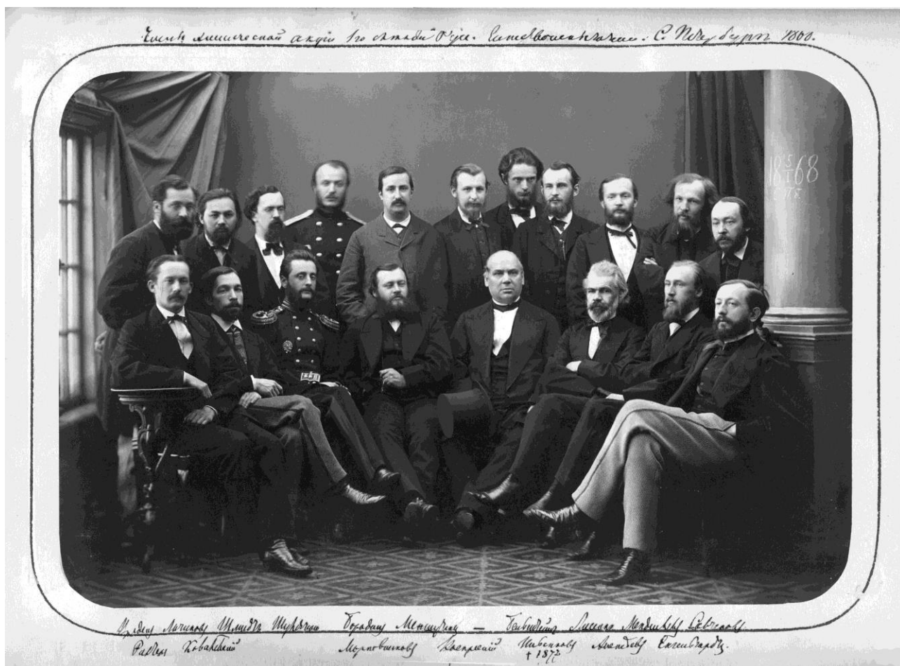
Бородин среди основателей Русского химического общества (фото 1868 года)

Бородин – автор более 40 работ по химии. Именно А. П. Бородин открыл способ получения бромзамещённых жирных кислот действием брома на серебряные соли кислот, известный как реакция Бородина – Хундикера; получил первое фторорганическое соединение фтористый бензоил (1862); исследовал ацетальдегид, описал альдоль (наиболее известный представитель альдегидоспиртов) и реакцию альдольной конденсации. Ему принадлежат также исследования в области физиологической химии и санитарно-химических проблем: предложил способ определения азота в моче (1875), сконструировал прибор для количественного определения мочевины азотометрическим методом, исследовал дезинфицирующие средства.