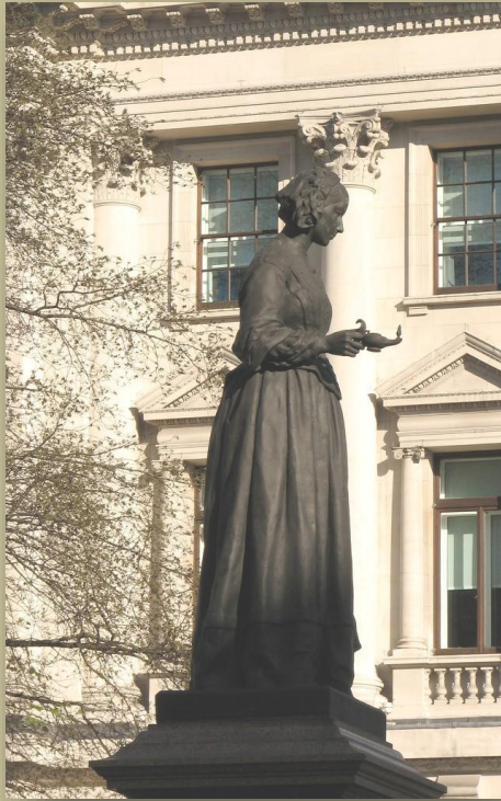
Памятник Ф. Найтингейл в Лондоне

О жизни и судьбе Флоренс Найтингейл снято несколько документальных и художественных фильмов. В 1951 году вышла на экраны британская историческая кинолента режиссёра Герберта Вилкокса «Леди с лампой». Ф. Найтингейл посвящены также фильмы режиссёров Дэрила Дьюка (1985) и Нормана Стоуна (2008).