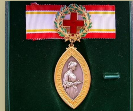
Медаль имени Флоренс Найтингейл

День 12 мая был официально утвержден в 1971 г. Международным советом медицинских сестер как Международный день медицинской сестры.