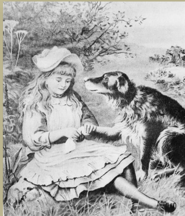
Флоренс и раненая колли

Современники Флоренс Найтингейл отмечали, что она была талантливой личностью и свои способности могла реализовать в самых различных сферах деятельности, но ее выбором стала медицина.