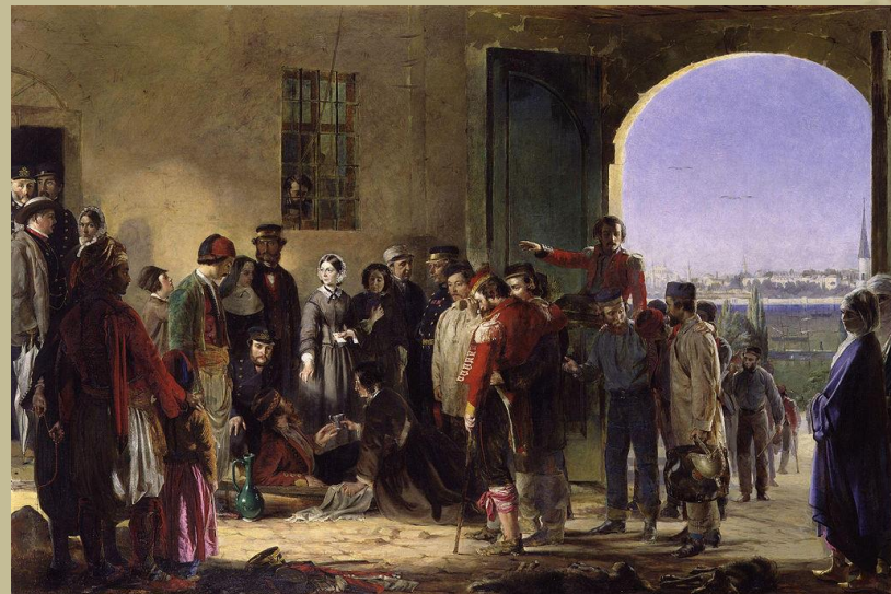
Ф. Найтингейл принимает раненых в госпитале Скутари, 1856-1858 гг.

В октябре 1854 г. во время Крымской войны Флоренс Найтингейл вместе с 38 помощницами отправилась в полевые госпитали сначала в Скутари (Турция), а затем в Крым. Взору сестер предстала жуткая картина: госпиталь был переполнен, завшивленные раненые и больные лежали в коридорах на соломе среди нечистот, по полу бегали крысы, не хватало самого необходимого – лекарств, белья, продовольствия, топлива.