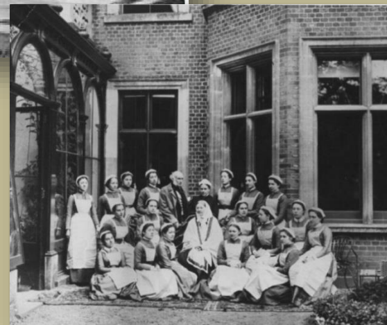
Ф. Найтингейл и выпускницы ее Школы медсестер в Лондоне