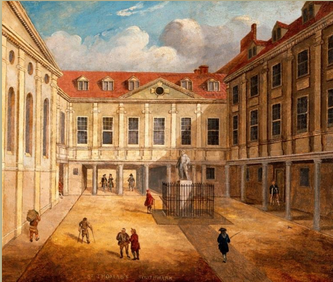
Госпиталь святого Томаса. Лондон

После возвращения домой Флоренс Найтингейл предложили взять на себя руководство учреждением по уходу за больными. Это привело семейство Найтингейл в ярость, и Флоренс была вынуждена покинуть семью и уехать в Англию. В 33 года Флоренс Найтингейл заняла должность суперинтенданта в учреждении по уходу за больными женщинами из высшего лондонского общества, где в полной мере показала свои организаторские способности и профессиональные навыки по уходу.