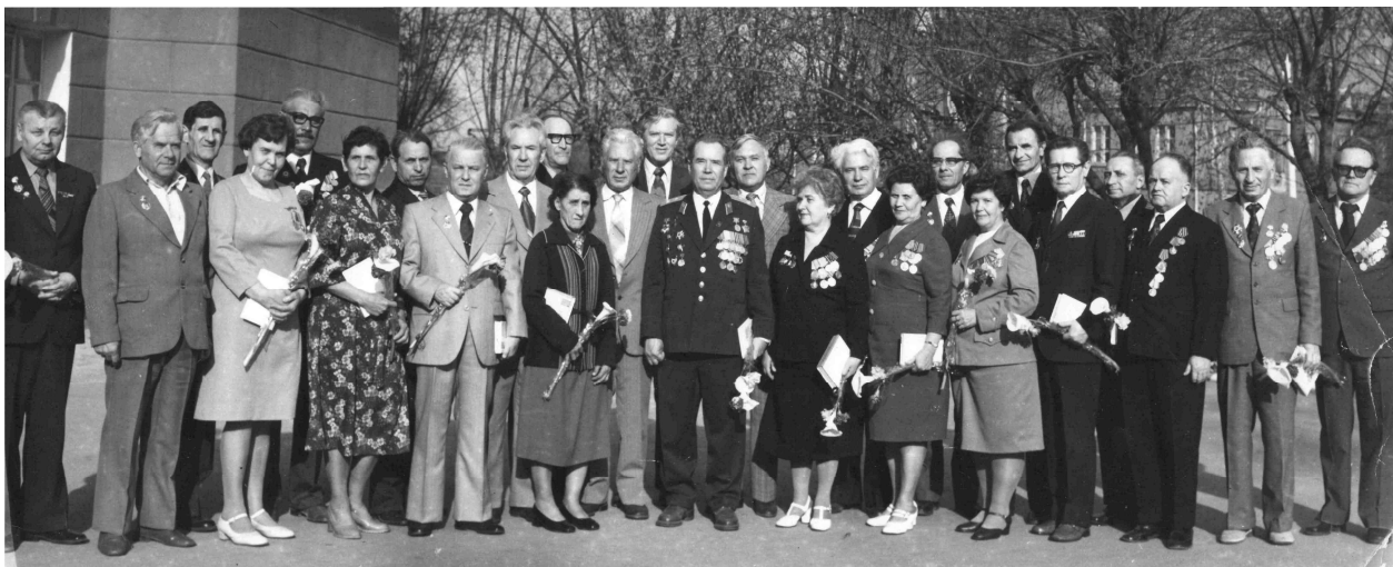
Ветераны Великой Отечественной войны – сотрудники КГМУ

Поклонимся великим тем годам, Тем славным командирам и бойцам, И маршалам страны, и рядовым, Поклонимся и мертвым, и живым- Всем тем, которых забывать нельзя, Поклонимся!..