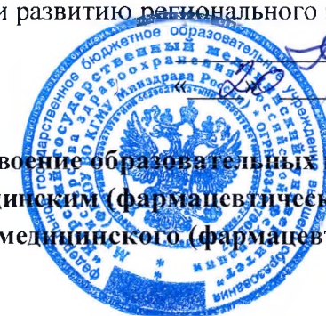
График проведения 2, 3 этапов экзамена по допуску лиц, не завершивших освоение образовательных программ высшего медицинского (фармацевтического) образования, а также лиц с высшим медицинским (фармацевтическим) образованием к осуществлению медицинской (фармацевтической) деятельности на должностях среднего медицинского (фармацевтического) персонала на 2024/2025 уч. год весенний семестр