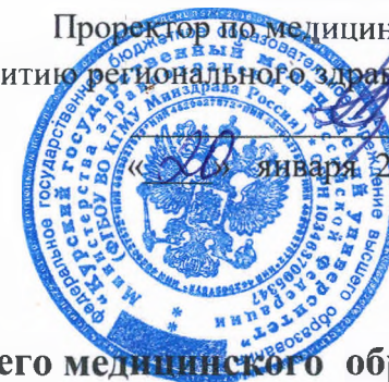
График проведения экзамена

по допуску лиц, не завершивших освоение образовательных программ высшего медицинского образования, освоивших образовательную программу высшего медицинского образования по специальности «Лечебное дело», «Педиатрия», «Стоматология» в объеме 4 курсов, к осуществлению медицинской деятельности на должности фельдшера скорой медицинской помощи в составе выездной бригады скорой медицинской помощи на 2024/2025 уч. год (весенний семестр).