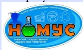
Рис. 1. Логотип научного общества молодых ученых и студентов УГМУ

Оформление рисунка представлено на рисунке 1.