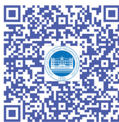
Как вести себя при обстреле

Просто наведите камеру вашего смартфона на QR-код, и нужный материал автоматически скачается на ваше устройство в формате PDF. Вы сможете просмотреть памятки с алгоритмами действий в любое удобное для вас время, распечатать или переслать их коллегам и знакомым. А в случае возникновения экстренной ситуации памятка будет всегда при вас, в вашем мобильном устройстве.