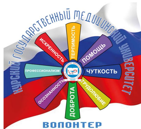
Первый логотип форума и волонтерских отрядов КГМУ

Более десяти лет КГМУ способствует развитию волонтерского движения. Первые отряды были созданы в КГМУ в 2007 году. Волонтерские отряды имели социальную и психологическую направленность, в меньшей степени – медицинскую.