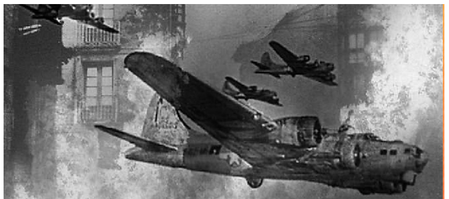
На снимке: массированная бомбардировка Ленинграда

Поздравляем с праздником Великой Победы!