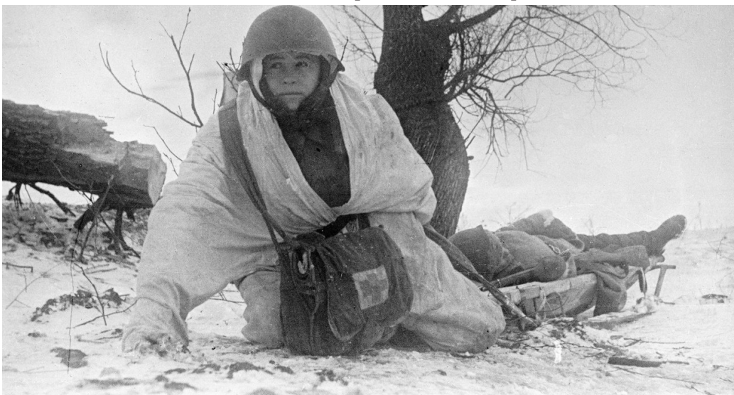
В период Великой Отечественной войны (1941-1945 гг.) советскими военными медиками было возвращено в строй после излечения 72,3% раненых и 90,6% больных

За участие в рейде советского воинского соединения по вражеским гарнизонам я был награжден медалями «За боевые заслуги» и «За оборону Москвы».