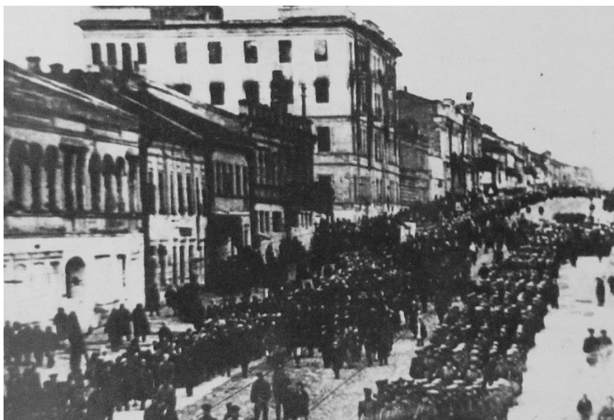
НА СНИМКЕ: на улицах освобожденного Курска