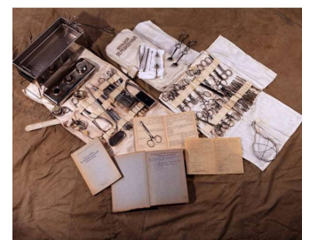
Набор медицинских инструментов для помощи раненым