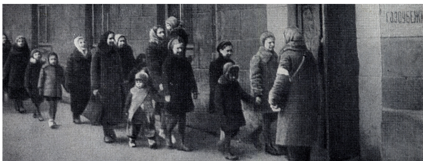
На снимке: по сигналу «Граждане! Воздушная тревога!» люди укрываются в бомбоубежище

«Ни вечера, ни выпускного бала Нам не устроил институт. Война повсюду наступала, Разрушив городской уют»