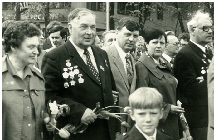
На снимке: сотрудники кафедры кожных и венерических болезней КГМИ

Все, кто хотя бы однажды в своей жизни, встретился с ним, навсегда сохранят светлую память об этом благородном человеке, прекрасном враче, замечательном педагоге и ученом.