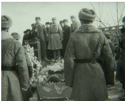
НА СНИМКАХ: похороны С.Н. Перекальского

Страна высоко оценила их героизм. Они были награждены орденами Красной Звезды.