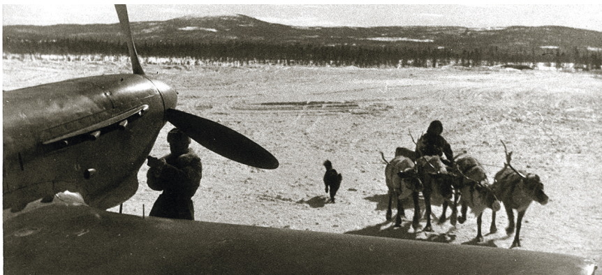
НА СНИМКЕ: война в Заполярье