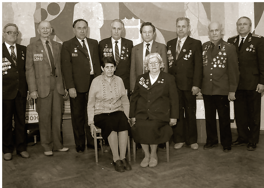
НА СНИМКЕ: ветераны Великой Отечественной войне

Трудно перечислить всех, кто вместе с воинами Красной Армии делил тяготы войны. Они не ходили в атаку. У них были свои сражения, сражения за человеческие жизни. И в каждом подвиге советского солдата есть доля труда людей в белых халатах.