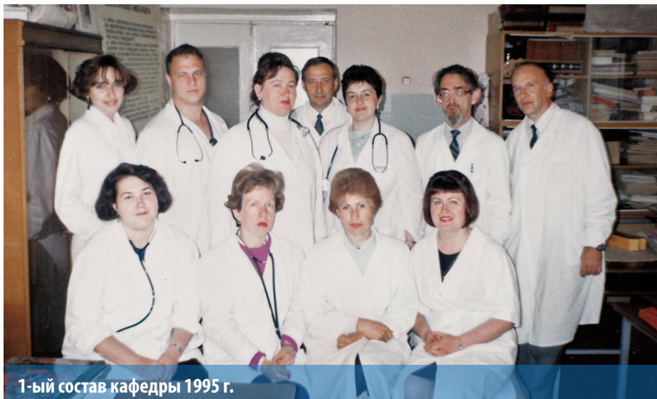
1-ый состав кафедры 1995 г.

Для обучения врачей и осуществления научной деятельности используются инструментально-лабораторные производственные мощности базового клинического учреждения, в том числе отделений кардиологии, гастроэнтерологии, регионального сосудистого центра, функциональной и ультразвуковой диагностики, эндоскопического и рентгенологического отделений, общеклинической, биохимической, гематологической, цитологической и иммуноферментной лабораторий.