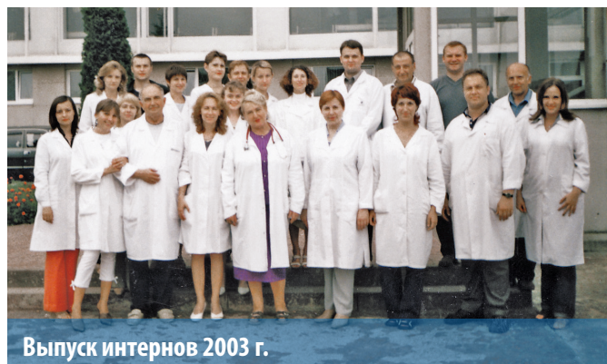
Выпуск интернов 2003 г.

Сегодня сотрудниками кафедры, среди которых три профессора, применяются как современные так и традиционные педагогические технологии: программное