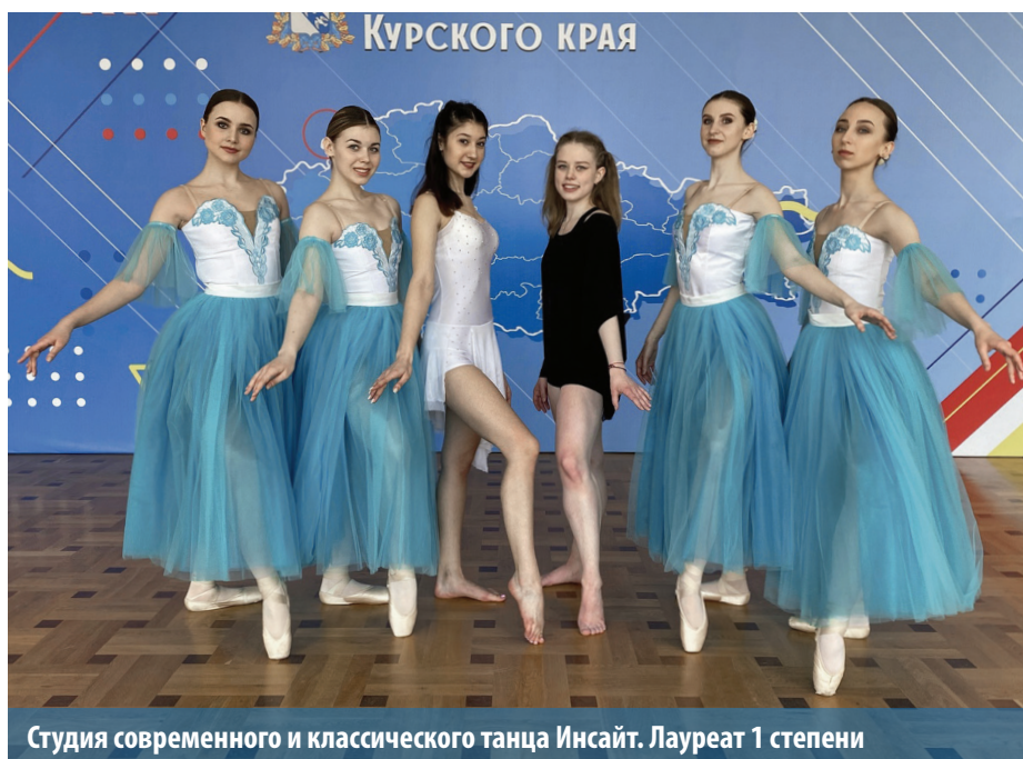
Студия современного и классического танца Инсайт. Лауреат 1 степени

По итогам Студвесны наши студенты получили 13 дипломов лауреатов и 23 стали дипломантами фестиваля. Хотим поблагодарить всех студентов КГМУ – участников «Студенческой весны-2021» и наших творческих педагогов за высокий уровень подготовки, профессионализм и прекрасные творческие номера!