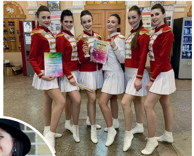
Обладатели Гран-при Международного конкурса талантов «Звёздный час» Ансамбль барабанщиц «Ритм сердца»

Этот масштабный Всероссийский фестиваль, который открывает горизонты творчества всей талантливой молодежи региона, проходил в регионе уже в 36-й раз. По распоряжению Губернатора Курской области он должен был проводиться с 1 марта по 21 апреля, но из-за коронавирусной инфекции, которая не обошла и наш регион, дни творческих состязаний пришлось сократить. Между тем праздник получился ярким и щедрым на победителей. Как всегда ребята из нашего университета оказались в первых рядах. Это не случайность, а результат большого творческого труда. На суд жюри были представлены умения в вокальном, хореографическом и сценическом искусствах.