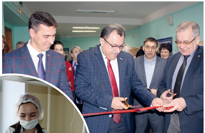
Торжественное разрезание ленты на открытии нового 9-этажного учебно-лабораторного корпуса КГМУ, где разместился мультипрофильный аккредитационно-симуляционный центр (МАСЦ)

Главное то, что на манекенах учатся будущие медики. Чтобы потом не совершать ошибок на живых пациентах.