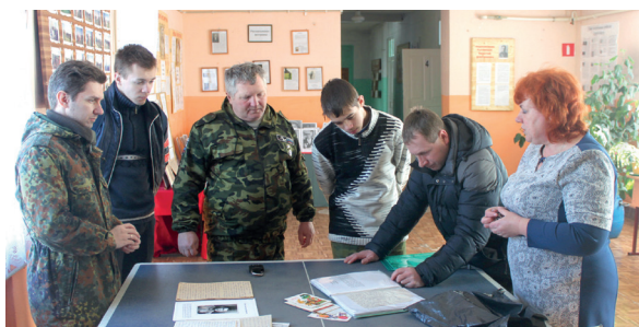
Волонтёрский поисковый отряд «Снежный десант»

Обучающиеся принимают активное участие в волонтёрском движении, поисковых отрядах, спортивных мероприятиях, художественной самодеятельности, вечерах памяти, заседаниях философских, психологических и исторических клубов, научных конференциях. Одним из центров патриотического воспитания является музей КГМУ, в котором студенты знакомятся с выдающимися выпускниками и героями военного времени, участниками Второй мировой войны, узнают о становлении университета. В течение учебного года в музее проводятся круглые столы, уроки мужества, творческие вечера, экскурсии для школьников, а в период пандемии музей можно посетить в онлайн-режиме. Память о достижениях студентов и сотрудников вуза имеет большое значение для формирования у студентов чувства