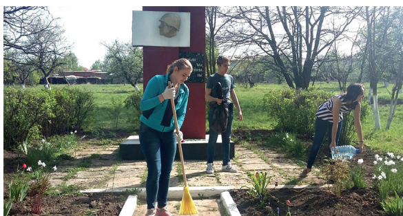
Студенческий совет КГМУ на уборке памятников