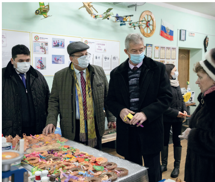
Гончарная мастерская школы-интерната