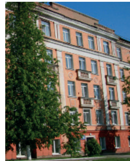
комнаты, оборудованные стиральными машинами.

Для поддержания здорового образа жизни обучающихся в общежитиях оборудованы спортивные комнаты, на территории студенческого городка – открытые спортивные площадки. Во всех общежитиях имеются прачечные