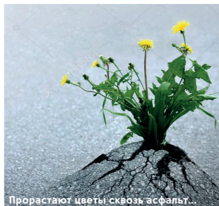
Прорастают цветы сквозь асфальт...

В книге «Интересные времена» Терри Прачетт рассуждает: «Люди любят выносить однозначные суждения. Возьмём, к примеру, чудеса. Если благодаря загадочному стечению обстоятельств кто-то спасается от неминуемой гибели – что обычно говорят? «Он чудом спасся». Но если по капризу не менее загадочного стечения обстоятельств (пролитое именно тут масло, подгнившая именно там ступенька) человек вдруг погибает... Согласитесь, вполне логично заключить, что это тоже было чудо. Факт неприятности происшедшего вовсе