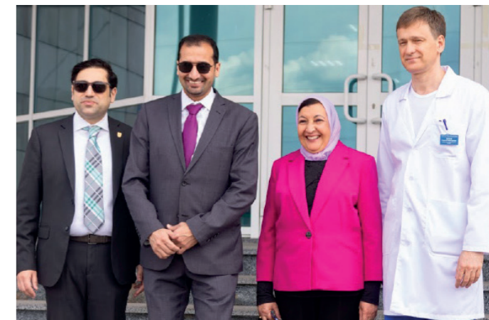
ния практических медицинских навыков с использованием инновационных обучающих технологий.

Делегация посетила клинические базы университета: областной клинический онкологический диспансер, областной перинатальный центр, НИИ генетической и молекулярной эпидемиологии и центр аккредитации и симуляционного обучения КГМУ, где гостям провели демонстрацию освое-