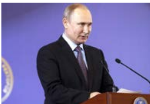
Выступление В. Путина на пленарном заседании