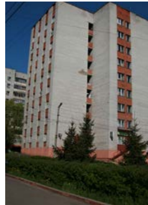
Во всех общежитиях имеются прачечные комнаты, оборудованные стиральными машинами.

Для поддержания здорового образа жизни обучающихся в общежитиях оборудованы спортивные комнаты, на территории студенческого городка – открытые спортивные площадки.