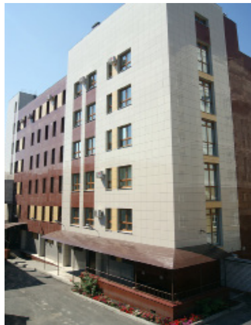
Ежегодно в ИЛЦ проводится несколько тысяч исследований

В целях комплексной оценки влияния вредных факторов на здоровье населения, их отслеживания и прогнозирования создан отдел социально-гигиенического мониторинга, который оснащен современным компьютерным и навигационным оборудованием, программным обеспечением.