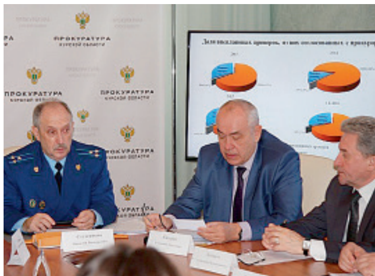
Снижение административной нагрузки должно идти в ногу с повышением социальной ответственности бизнеса