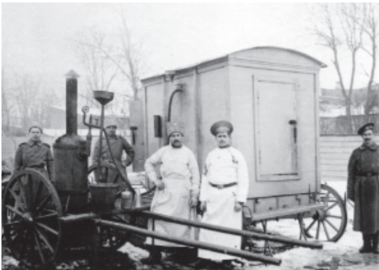
Передвижная дезинфекционная камера времен Первой мировой войны