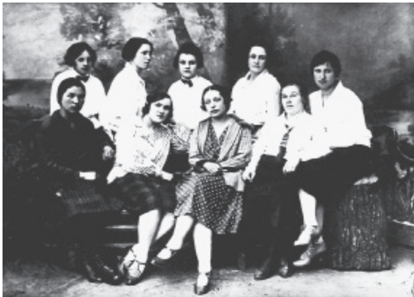
Актив санитарного кружка, г. Рыльск, начало 30-х годов

Принятие Закона Российской Федерации «О санитарно-эпидемиологическом благополучии населения» в 1991 г. ознаменовало новый этап в развитии санитарно-эпидемиологической службы: санэпиднадзор выводится из подчинения облздравотдела и переводится на уровень централизованного управления и федерального финансирования. «Положение о государственной санитарно-эпидемиологической службе РСФСР» от 01.07.91 г. создало объективные предпосылки к усилению Госсанэпиднадзора и позволило приступить к формированию нормативно-правовой базы по санитарно-эпидемиологическим вопросам.