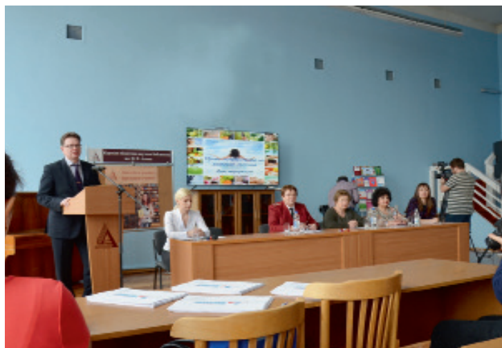
Информационный день для потребителей

В своей информационной политике служба стремится привлечь внимание общественности к проблемам, напрямую затрагивающим вопросы реального улучшения санитарно-эпидемиологического благополучия населения области, повышению правовой грамотности граждан, разъяснительной работе с предпринимательским сообществом.