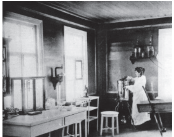
В лаборатории оспенного института