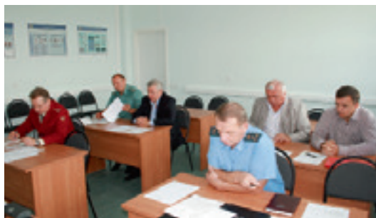
Тема семинара объединила специалистов целого ряда ведомств

За 2016 год в автомобильных пунктах пропуска Курской области подвергнуто карантинному контролю 19162 транспортных средства, 379 партий грузов; досмотрено на наличие симптомов инфекционных заболеваний, при прибытии в РФ и выезде из России, более 160 человек. Проводятся инструктажи с экипажами транспортных средств по проведению первичных противоэпидемических мероприятий в случае выявления