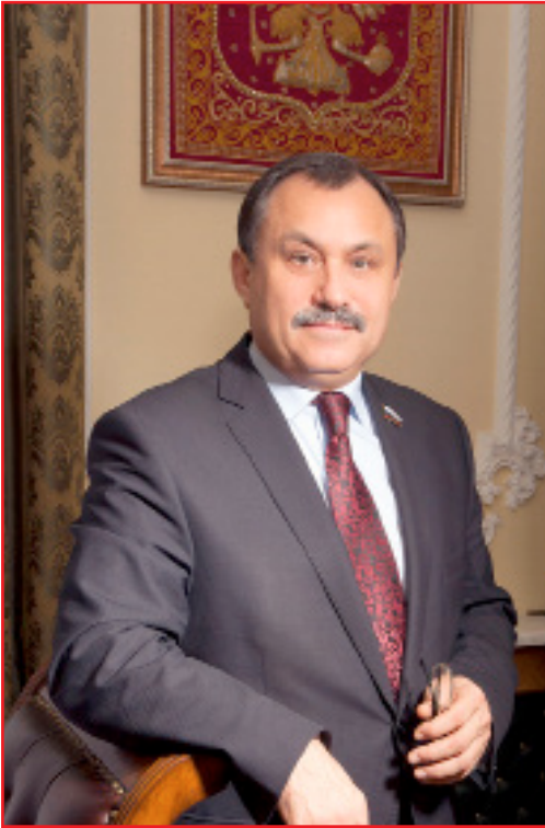
Виктор ЛАЗАРЕНКО, ректор Курского государственного медицинского университета