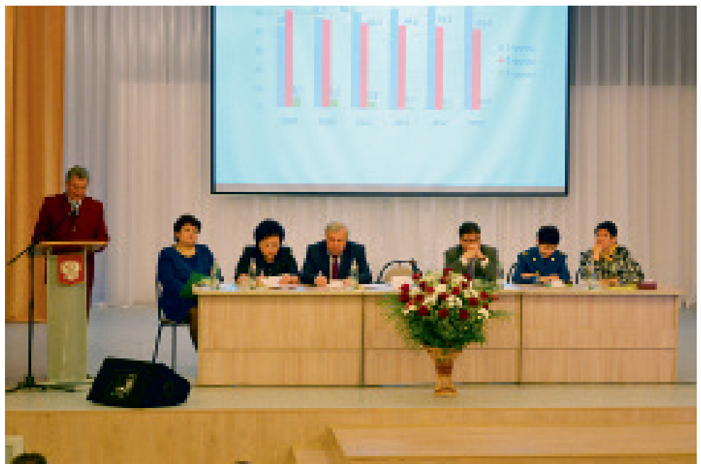
В повышении санитарно-эпидемиологического статуса региона заинтересованы все

В настоящее время, оставаясь верной традициям своих предшественников, служба Роспотребнадзора активно включается в выполнение актуальных на современном этапе государственных задач: на территории Курской области успешно реализован приоритетный национальный проект «Здоровье» в разделе дополнительной иммунизации на-