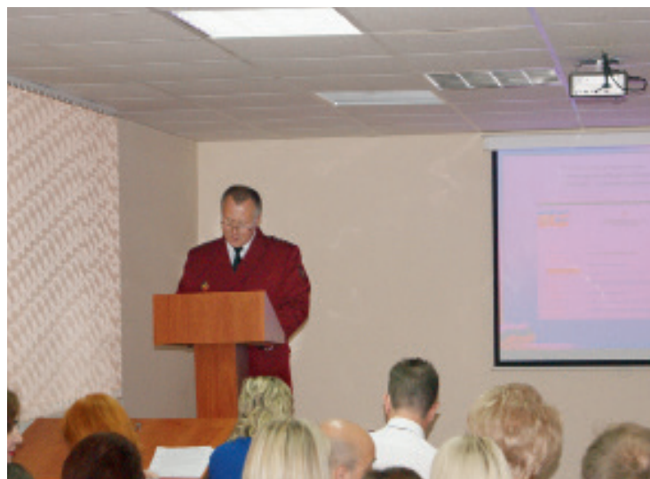
Публичные обсуждения правоприменительной практики Роспотребнадзора проходят в Управлении ежеквартально

селения, и Курская область сегодня стала одним из благополучных в санитарно-эпидемиологическом отношении регионов.