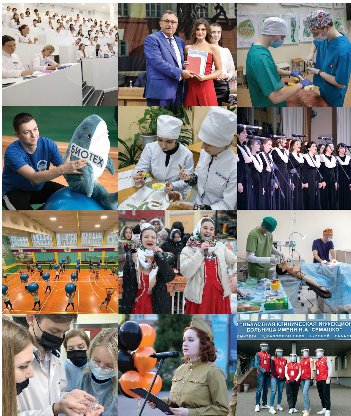
“ОБЛАСТНАЯ КЛИНИЧЕСКАЯ ИНФЕКЦИОННО-БОЛЬНИЦА ИМЕНИ Н.А. СЕМАШКО” ОМИТЕТА ЗДРАВООХРАНЕНИЯ КУРСКОЙ ОБЛАСТИ