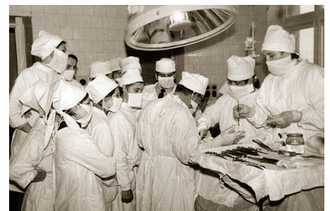
Практические занятия по хирургии. 60-е годы XX века

В 1960-1970-е гг. XX в. происходило дальнейшее укрепление института. Увеличился прием студентов с 250 до 350 чел., открылось вечернее отделение, а в 1966 году был организован новый – фармацевтический – факультет.