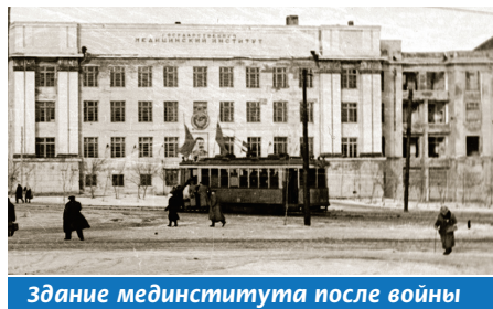
Здание мединститута после войны

В разгар боев на подступах к городу Курску 8 октября 1941 года более 300 сотрудников и студентов, часть оборудования, учебные пособия и другое имущество были эвакуированы в г. Алма-Ату. В период пребывания в эвакуации, с декабря 1941 года по январь 1944 года, студенты и частично профессора и преподаватели находились в составе Казахского медицинского института.