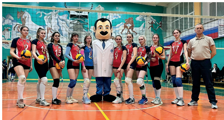
ЖЕНСКАЯ СБОРНАЯ КГМУ ПО ВОЛЕЙБОЛУ – ЧЕМПИОНЫ СПАРТАКИАДЫ ВУЗОВ КУРСКОЙ ОБЛАСТИ, 2023 г.