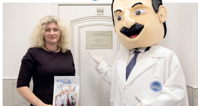
Начальник Центра довузовской подготовки и профориентации Института непрерывного образования

Воскресные подготовительные курсы. Обучение на воскресных подготовительных курсах ведется по выходным дням и включает в себя программу как одногодичной подготовки (для учащихся 11 классов и выпускников прошлых лет), так и программу