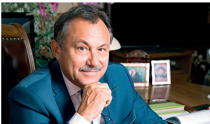
Ректор Курского государственного медицинского университета, заслуженный врач Российской Федерации, заслуженный деятель науки Российской Федерации, отличник здравоохранения Российской Федерации, доктор медицинских наук, профессор, депутат Курской областной думы, почетный гражданин г. Курска

Приглашаю вас в Курский государственный медицинский университет. Мало того, что наш вуз является одним из ста лучших в России, он еще и располагает богатейшей историей, насчитывающей 88 лет! Но и это далеко не все! Наш медуниверситет обладает мощной преподавательской и научной базой, имеет клинические кафедры в лучших больницах города Курска. Вас ждут встречи с увлеченными своим делом преподавателями, которые всегда рады передать свои знания. В КГМУ трудятся более 100 докторов наук и 500 кандидатов наук. Кроме того, у нашего вуза высокая международная репутация, а это гарантия того, что вы получите образование, отвечающее мировым стандартам.