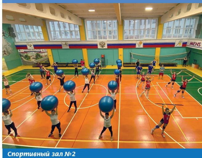
Спортивный зал №2