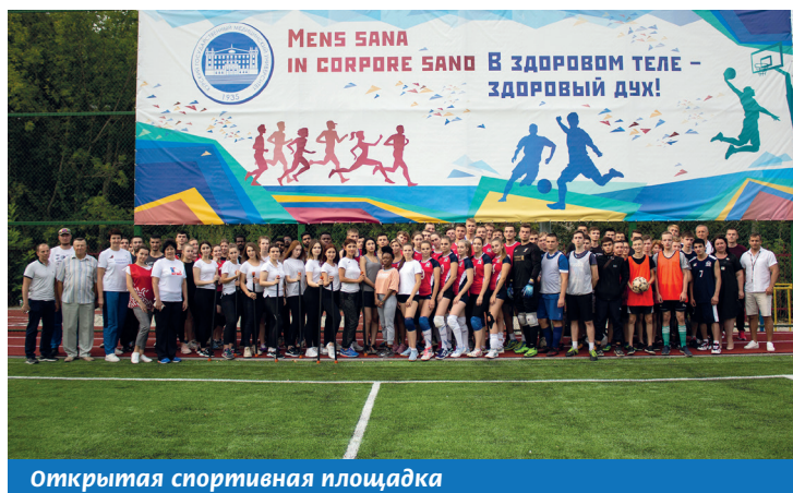
Открытая спортивная площадка

В 2020 году в КГМУ открыта многофункциональная Открытая спортивная площадка, предназначенная для мини-футбола, волейбола, баскетбола, бадминтона, легкой атлетики, учебного многоборья ГТО. При каждом общежитии есть открытые площадки с уличными тренажерами, шахматная площадка на территории главного корпуса.