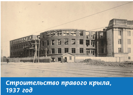
Строительство правого крыла, 1937 год